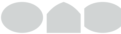
categorie G - 2 togen / ovaal

's-Gravensandseweg 11a 2291 PE Wateringen | Nederland +31 (0)15 2139315 info@vanruysdael.com www.vanruysdael.nl IBAN NL18 INGB 0006 8980 45 KVK 63903024 BTW NL.8554.47.096.B01