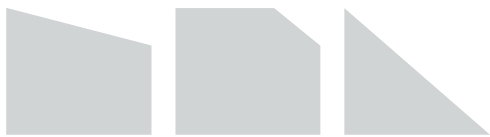
categorie B - 1 schuine zijde