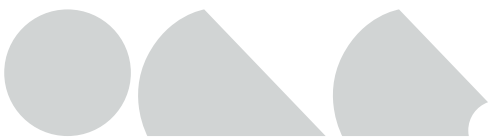
categorie H - circle / taartpunt