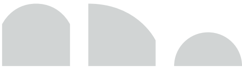
categorie F - I toog