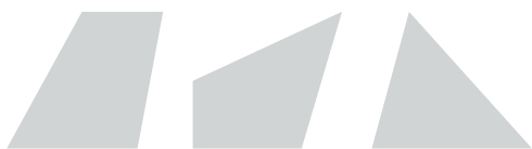
categorie C - 2 schuine zijden