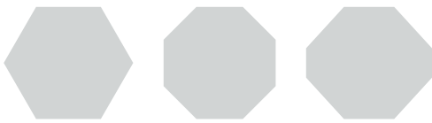
categorie E - veelhoek

's-Gravensandseweg 11a 2291 PE Wateringen | Nederland +31 (0)15 2139315 info@vanruysdael.com www.vanruysdael.nl IBAN NL18 INGB 0006 8980 45 KVK 63903024 BTW NL.8554.47.096.B01